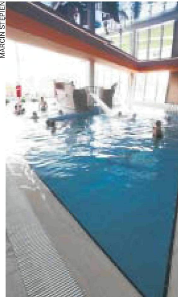
Termy w Uniejowie

Ostatnim laureatem zostało oddanie do użytku małej sali Teatru Powszechnego. Propozycja ta wygrała zdecydowanie. Głosowało na nią aż 55 proc. uczestników zabawy. Budowa kosztowała ponad 9 mln zł. - To nagroda dla całego naszego zespołu - mówi-